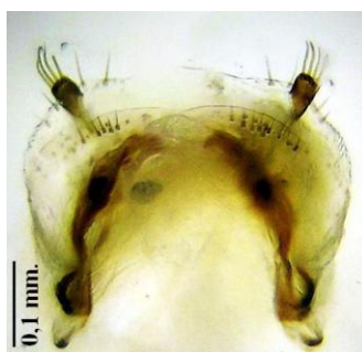
Figura 3. Ginopigio

1 individuo hembra procedente de Barranco de Teatinos, río Darro, Quéntar, Granada; UTM: 30SVG51; 30/06/2004; A. Anichtchenko leg., Verdugo coll.