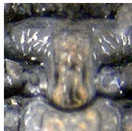
Figura 2. Placa prosternal