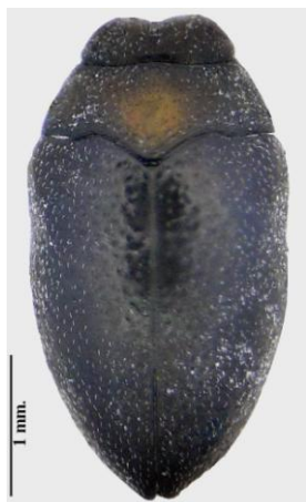
Figura 4. Hábitus del espécimen granadino.