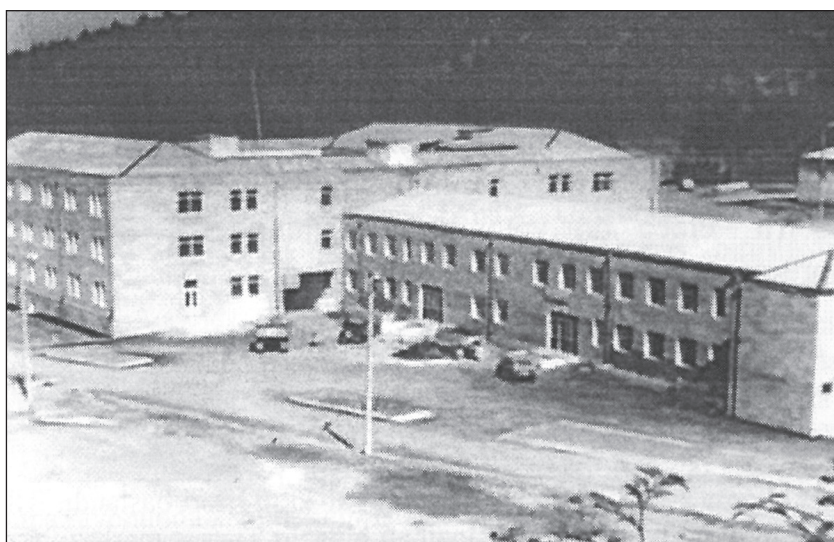
Zəngilan rayon mərkəzi xəstəxanasının işğal ərəfəsindəki binası