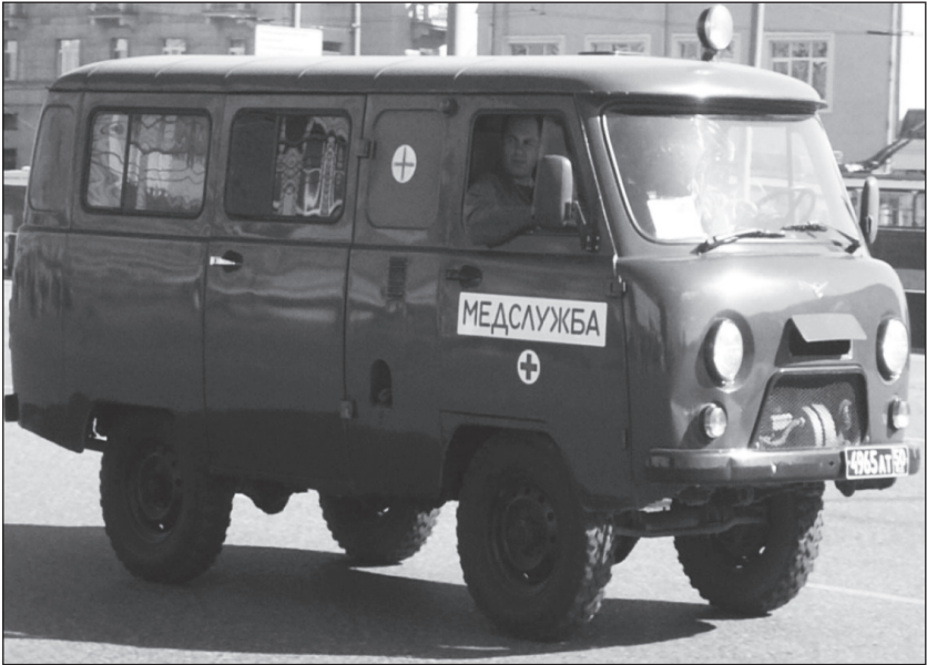
Ишғал әрәфәсиндә истифадә олунан тәчили ярдими машини нумунәси