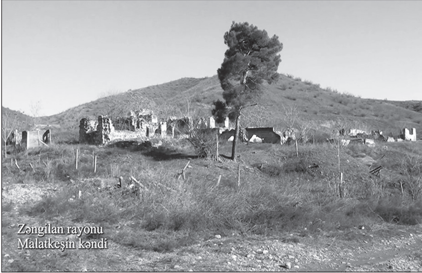
Sultan Vəliyevin doğulduğu Malatkeşin kəndi işğaldan sonra