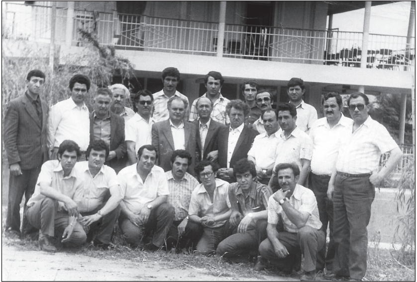
Sultan həkim xəstəxanasının tibbi personalı və dostları ilə birlikdə