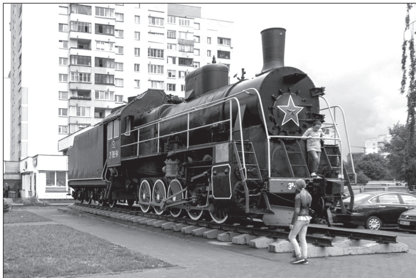
Paravoz (qara qatar)