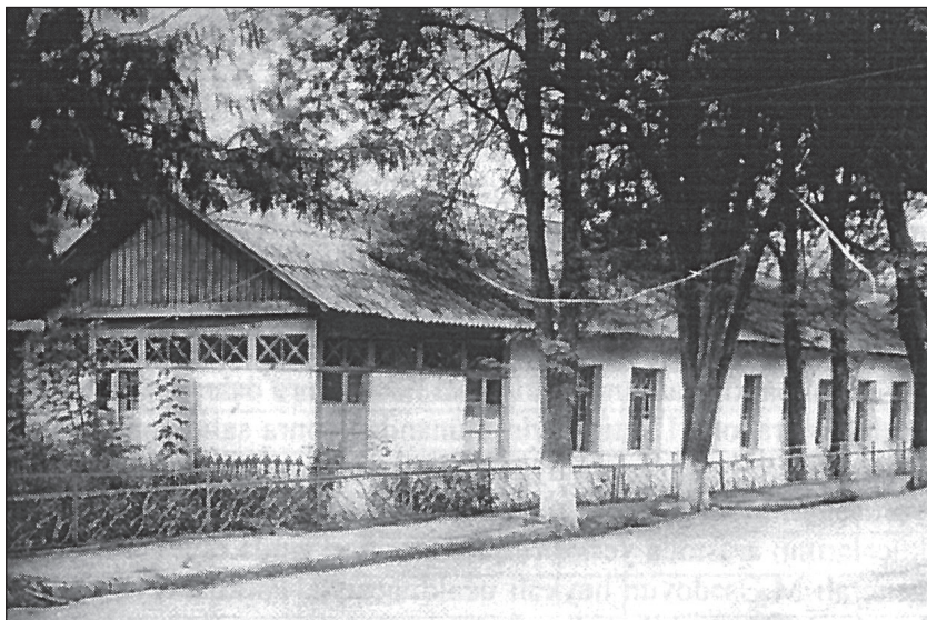
Sultan həkimin iş otağı 50-ci illərdə bu binada yerləşirdi