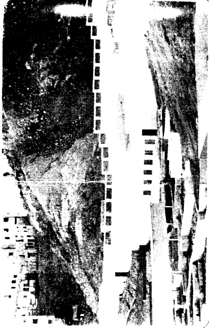
صورة مقرّبة لقبر السيدة خديجة ؑ